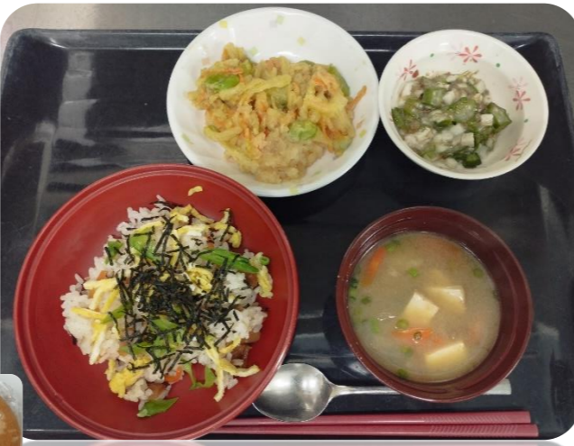
おやつは「節分おやき」でした