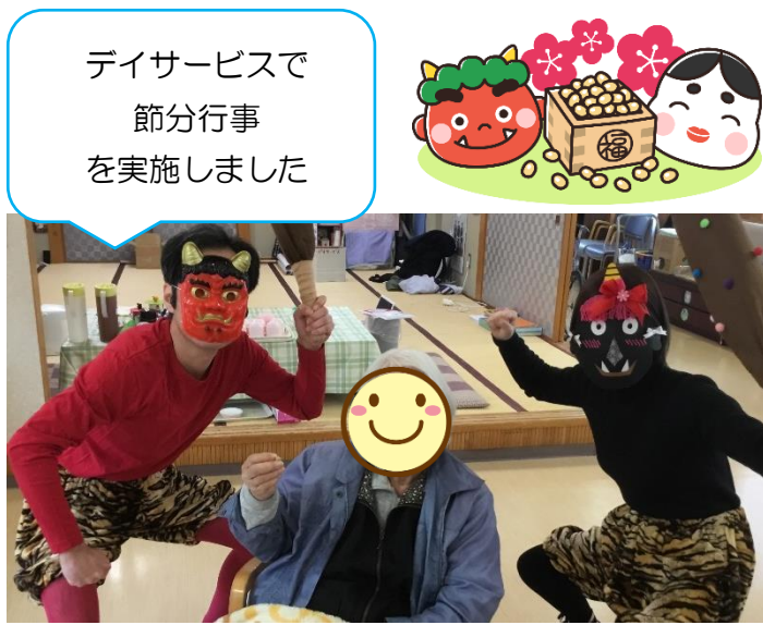
デイサービスで 節分行事 を実施しました

昨年暮れから2月初旬までコロナ感染のため 様々な行事を自粛していました。 やっと落ち着きを取り戻したので 行事等を再開しました！