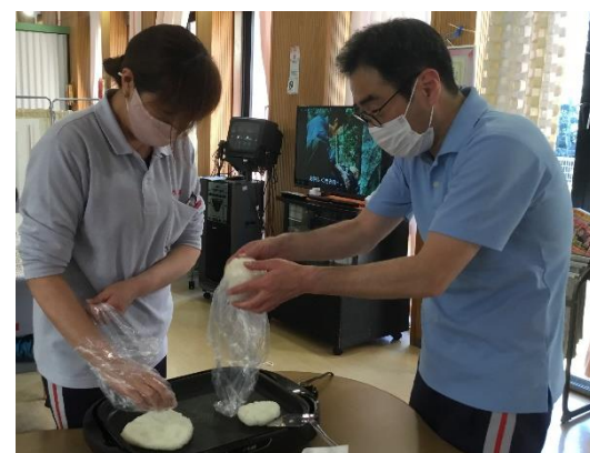
みそダレを塗り焼いていきます タレはくるみ味噌を アレンジして作りました