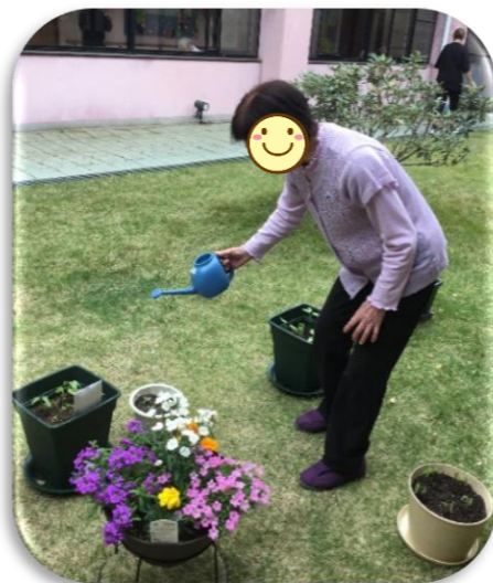
水やりはみんなで順番に行いました