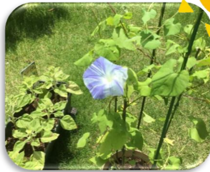
この夏は暑さが厳しく、植物の成長にも影響が...