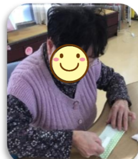
ちりめん布の色や柄を選んでいただきました