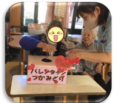
たくさんつかんでね