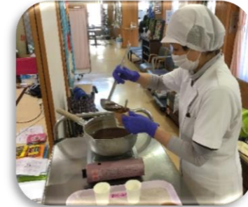
寒い日はお汁粉最高～