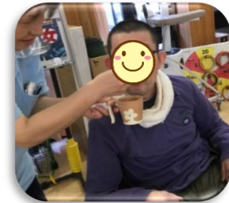
ほっこり♡温まりました