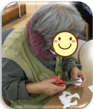
ピンポン玉にちりめん布を貼ります