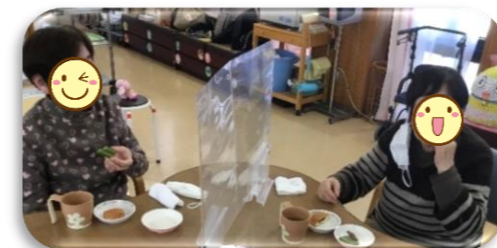
色々な種類がありますね～