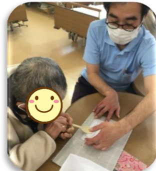
布にボンドを付けます